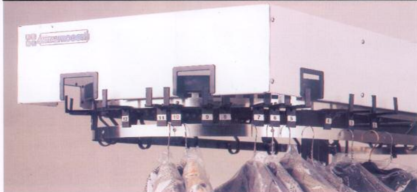
SOTTO: Modello C 70 CONTINUO con banda continua senza posizioni predeterminate. La banda può essere suddivisa in settori tramite cavallotti mobili numerati.